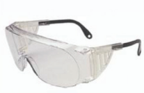
Lunettes de sécurité